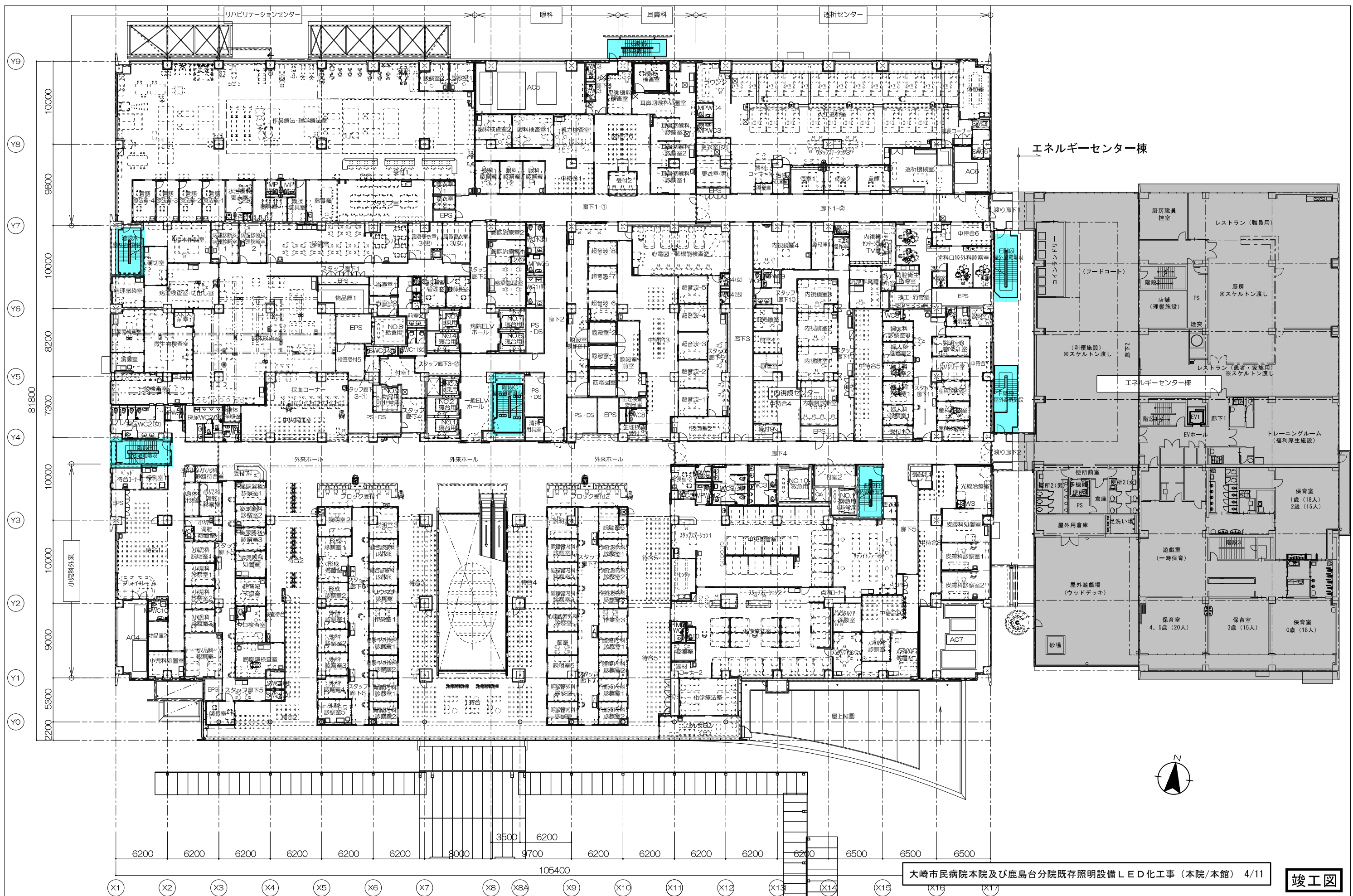
大崎市民病院本院及び鹿島台分院既存照明設備LED化工事（本院/本館） 4/11